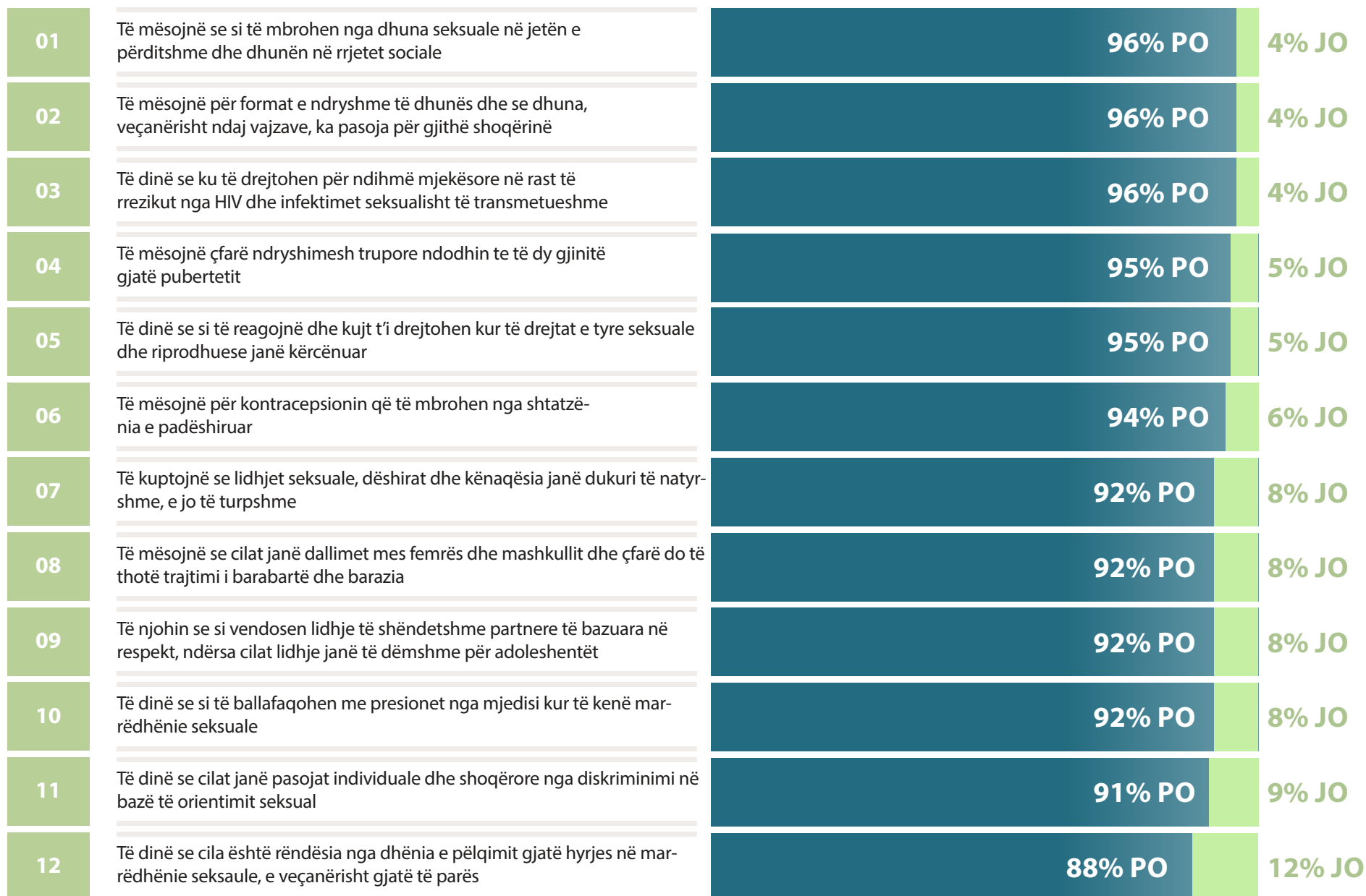
Grafiku 1: Temat të cilat të anketuarit mendojnë se të rinjtë duhet ose nuk duhet t'i mësojnë në shkollë - %